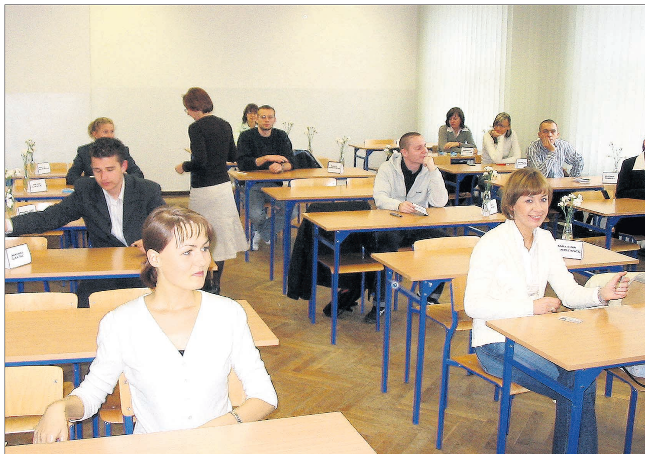
■ Accueil-Prüfungen. Das Test-Centre WSTiH (Wyzsza Szkoła Turystyki i Hotelarstwa) hat im Juni 2006 an der Universität in Lodz, Polen, Accueil-Prüfungen durchgeführt.

1998 hatte sich die Hotelfachschule Thun mit elf interessierten Partnern aus sieben europäischen Ländern im Projekt «Accueil» des EU-Berufsbildungsprogramms Leonardo zusammengeschlossen, um eine internationale Fremdsprachenprüfung mit Zerti-